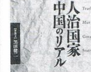
人治国家 中国のり